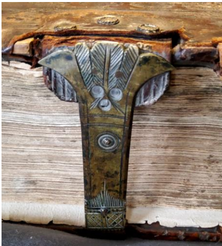
1 Exemplaar van het facsimile. De achterkant van het boek ligt boven.

De band is bekleed met leer, op de buitenkanten van voor- en achterplat is bovendien gestempeld leer aangebracht dat inmiddels versleten is: aan de randen zijn delen verdwenen, er zijn slijtageplekken op de platten en op de ribben in de rug. Zowel voor als achter loopt een scheur in het midden van het leer op het plat. De band en het boekblok zijn doorzeefd met wormgaten.